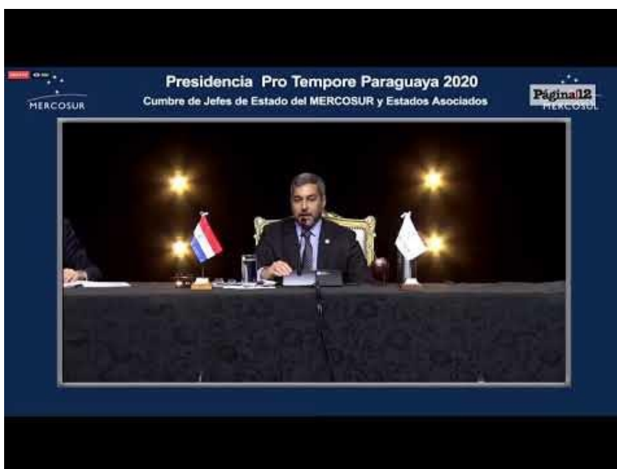
2 - Presidencia Pro tempore de PARAGUAY. MERCOSUR