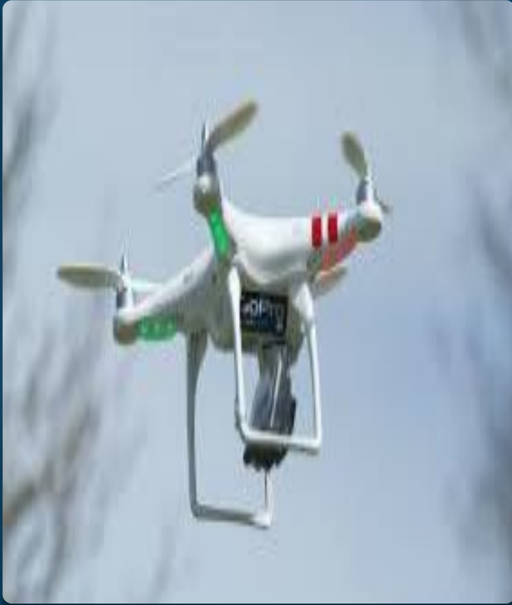
DJI Phantom - 1ra Generación 2014