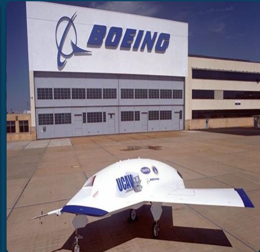
BOING prototipo (carga útil 200 kg) 2018