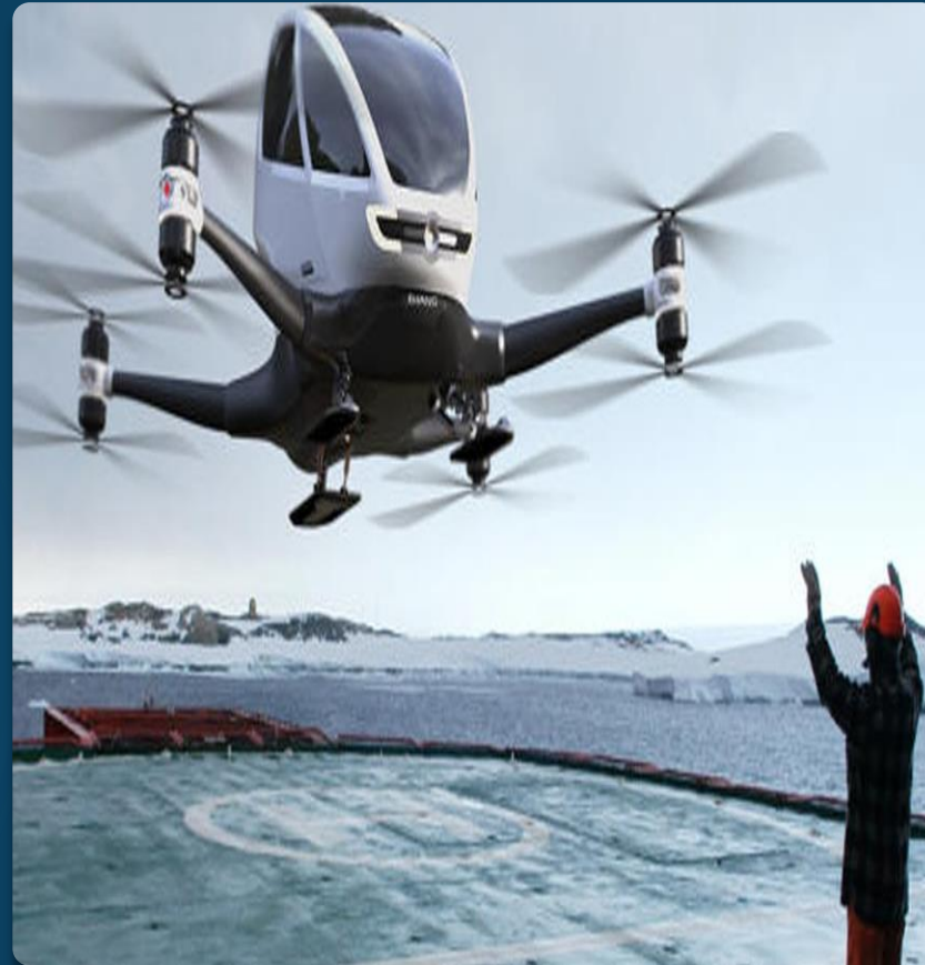
VAHANA prototipo Airbus 2016