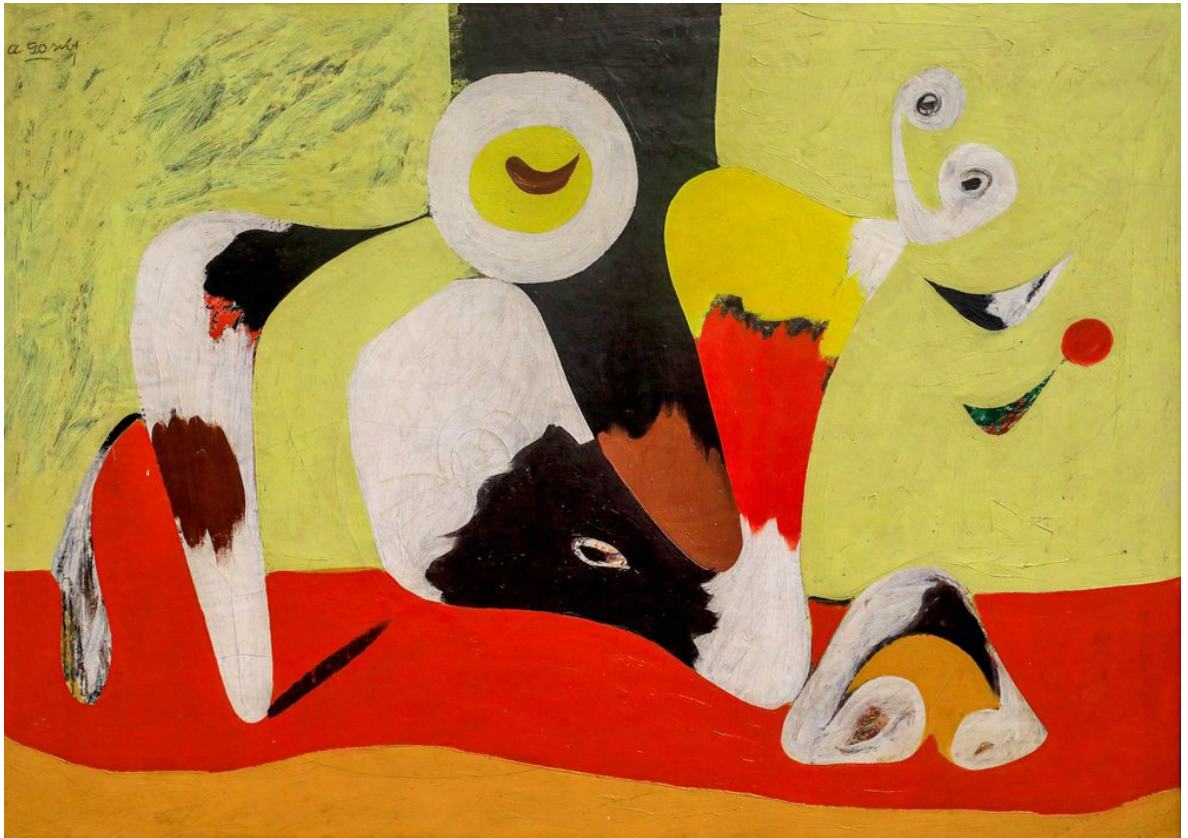
Mojave. Arshile Gorky, 1941. óleo sobre lienzo