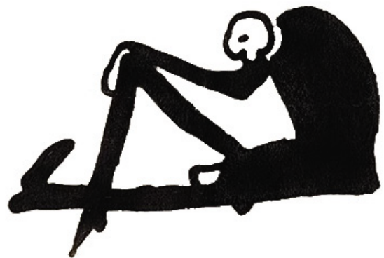
Franz Kafka. Cuadernos personales. Figura sentada. ca. 1917-1918. Tinta sobre papel. Bib. Nac. de Israel, Jerusalén.

La Comisión, al visibilizar estas percepciones, vuelve a colocar en agenda un aspecto central: la modernización tecnológica debe ir acompañada de estándares claros de calidad, transparencia y acceso efectivo a la justicia.