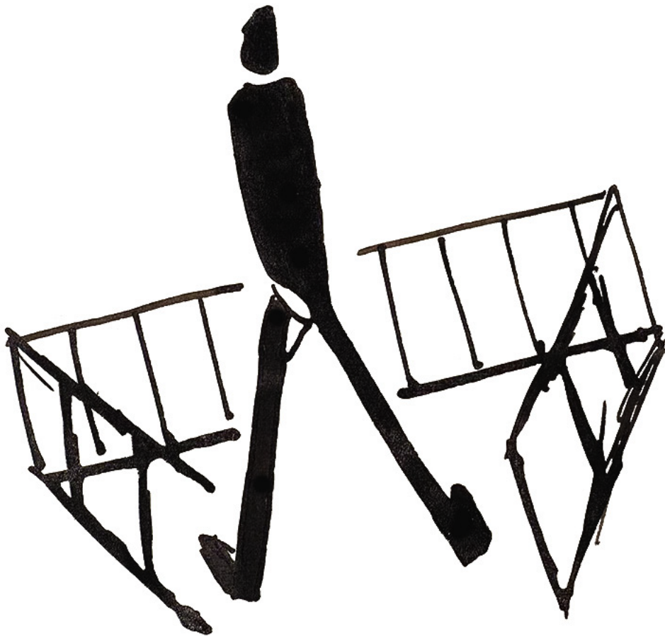
Franz Kafka. Cuadernos personales. Figura en los estrados. ca. 1917-1918. Tinta sobre papel. Bib. Nac. de Israel, Jerusalén.