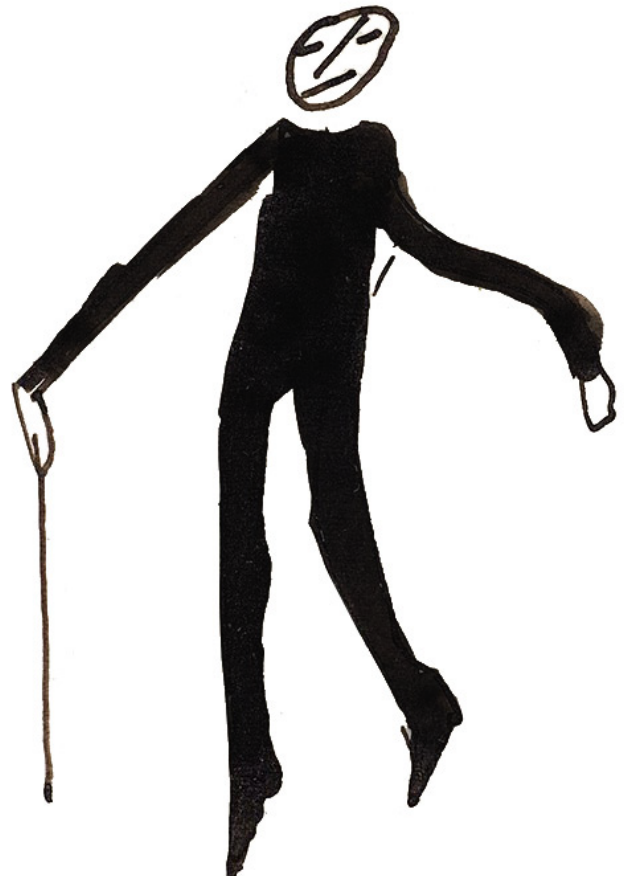
Franz Kafka. Cuadernos personales. Figura con bastón. ca. 1917-1918. Tinta sobre papel. Bib. Nac. de Israel, Jerusalén.

Las empleadas y los empleados judiciales son personal público,