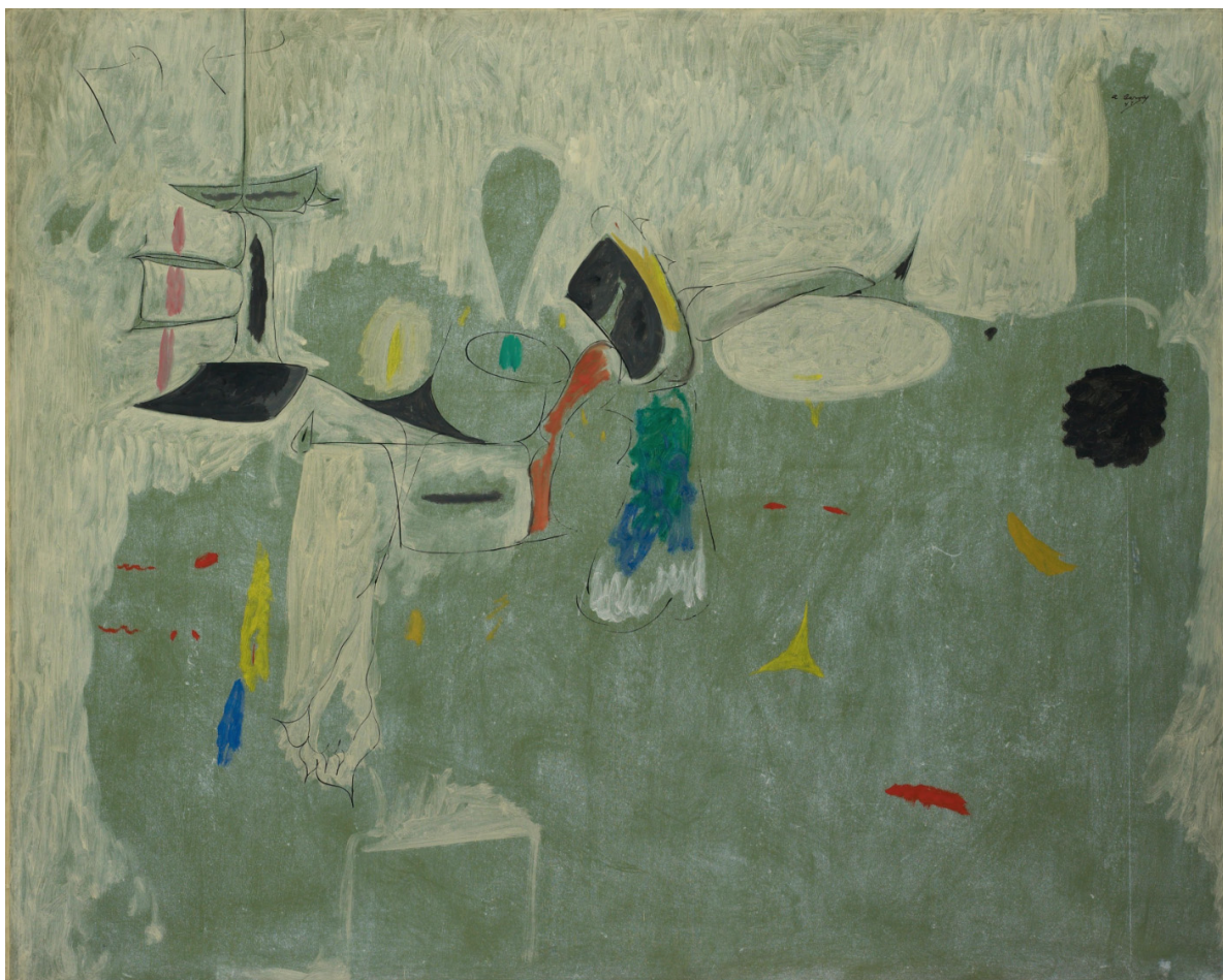
El límite. Arshile Gorky, 1947, óleo sobre papel transferido a lienzo

La Justicia de San Isidro se encuentra justificadamente cuestionada, y la publicación antes al comienzo de este Colegio debería leerse con atención, asumiendo con seriedad los graves señalamientos allí detallados que cabe aquí reiterar en su totalidad.